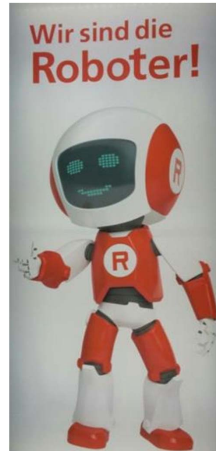
(Laden für private Roboter, Götzis/A 2016)

Prof. em. TU Chemnitz ISIFO e.V. München www.ggv-webinfo.de Twitter: @gguenter_voss